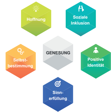
Abb. 1: Bausteine der Genesung

Zu unseren Behandlungs-, Beratungs- und Hilfeangeboten gehören Psychotherapie, Pharmakotherapie, Milieuthérapie, Beschäftigungs- und Kunsttherapie, Körperwahrnehmung sowie Physiotherapie. Ein besonderes Angebot unserer Abteilung ist die Begleitung und Unterstützung durch Genesungsbegleiter. Das sind Menschen mit eigener Psychiatrie- und Krisenerfahrung, die eine spezielle EX-IN-Ausbildung absolviert haben. In unseren multiprofessionellen Teams arbeiten Ärzte, Psychologen, Gesundheits- und Krankenpfleger, Sozialarbeiter, Ergotherapeuten und Genesungsbegleiter.